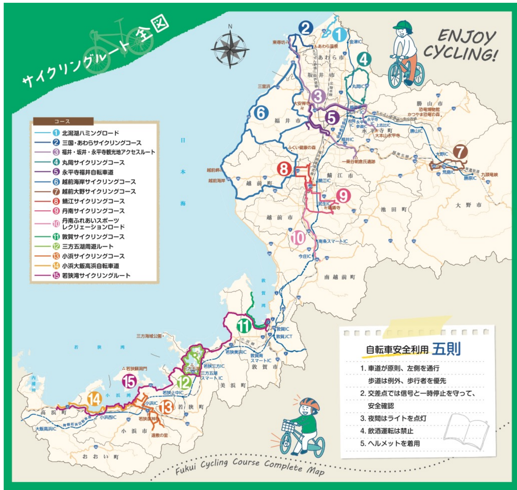
発行：福井県地域戦略部交通まちづくり課