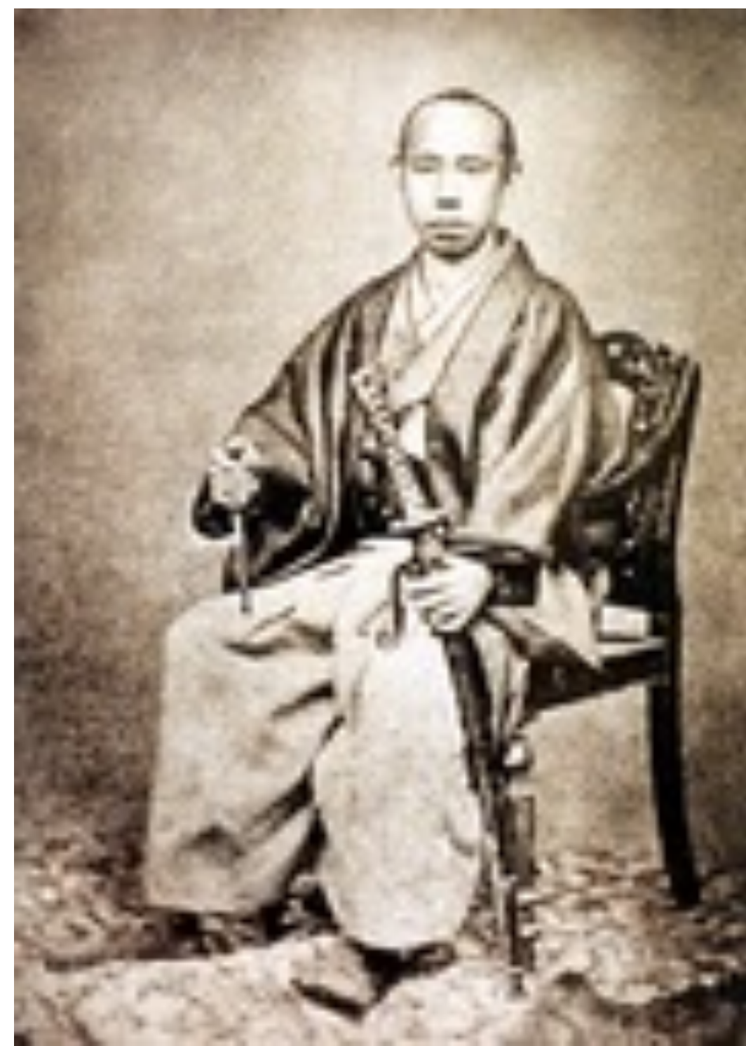
松平 春嶽 公