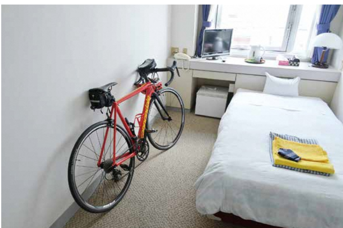
自転車を持ち込める客室

自転車を客室への持ち込みができる宿泊施設をサイクリストに優しい宿に認定。整備に係る補助金の交付も実施。