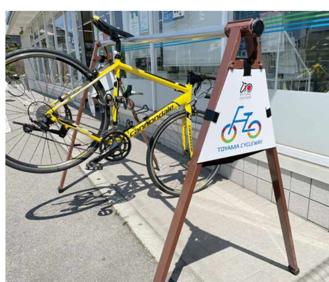
サイクルふらっとに設置されたバイクラック

サイクリスト向けサービスの提供を行うコース沿線の施設を、サイクルステーション(道の駅等)、サイクルカフェ(喫茶店等)、サイクルふらっと(コンビニエンスストア)として認定し、バイクラック、空気入れ、工具等を設置。