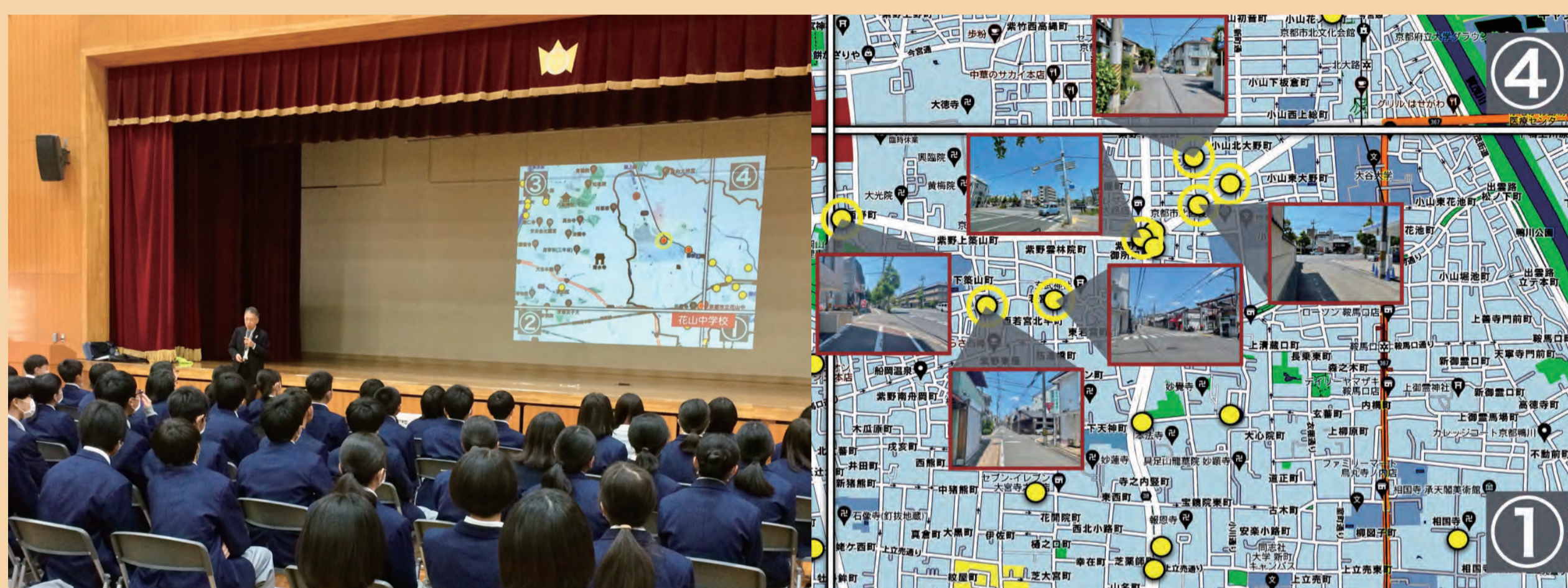
地域の自転車関連事故発生箇所

身近なこと=他人事から 自分事 へ 知識レベルに応じて 意識変化から行動変容へと導く