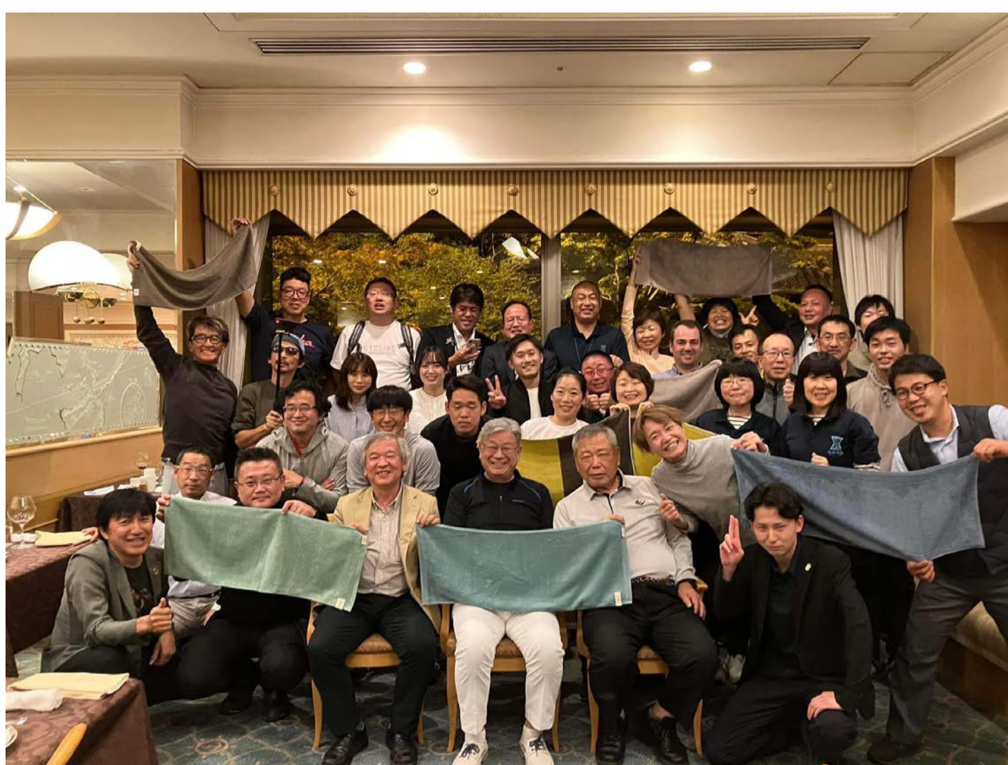
Local to Locals / サイクリングしまなみでのオルグウエア