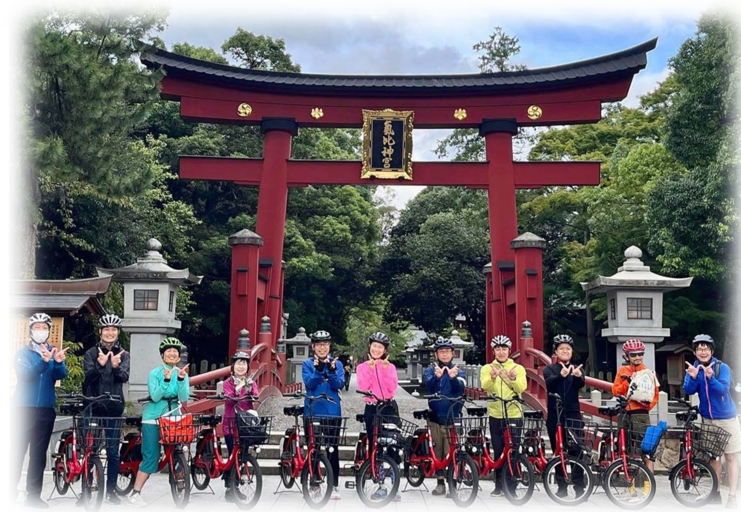
Local to Locals 福井県若狭湾サイクリングルート

NCR指定を目指し、地域課題解決、地方の高付加価値化をビジョンとして形成する。官民連携推進協議会として機能させる準備はオルグウエア（先進地事例を学び、地方同志が繋がる場作り）を定期的に継続し、必要な情報収集とネットワーク化を進める。役所内、地域内外の連絡調整推進機能が最も重要な役割を担う。自治体には情報収集と連絡調整を行う推進調整室を設置する人事が円滑に事業推進する鍵を握っている。