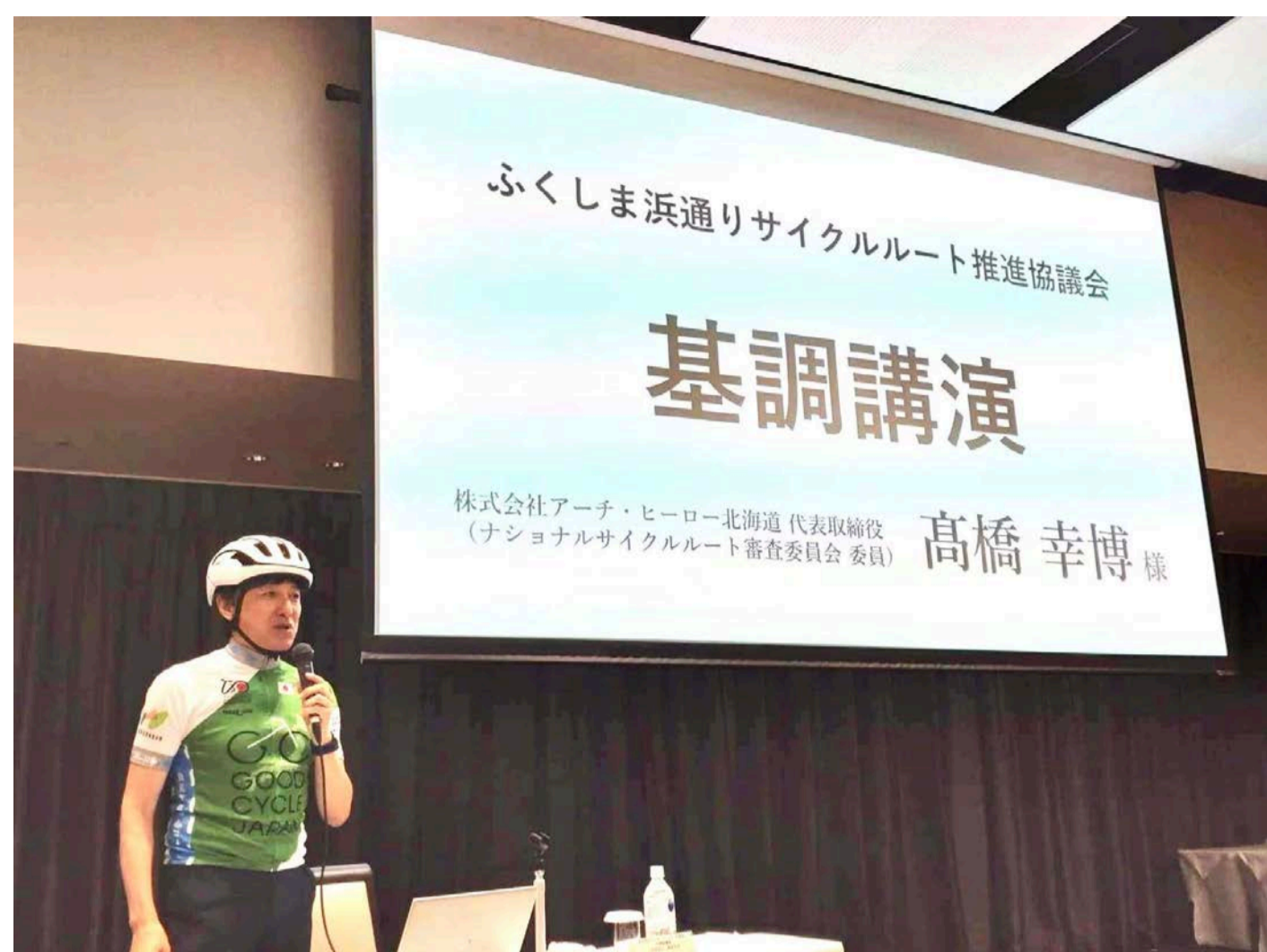
Local to Locals/NCRのビジョンについて講演（ふくしま浜通り推進協議会）