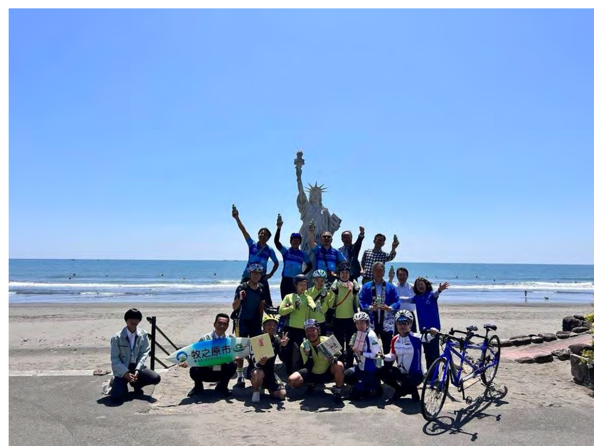
最高の太平洋と青空 自由の女神と 出会う（静岡県牧之原市）