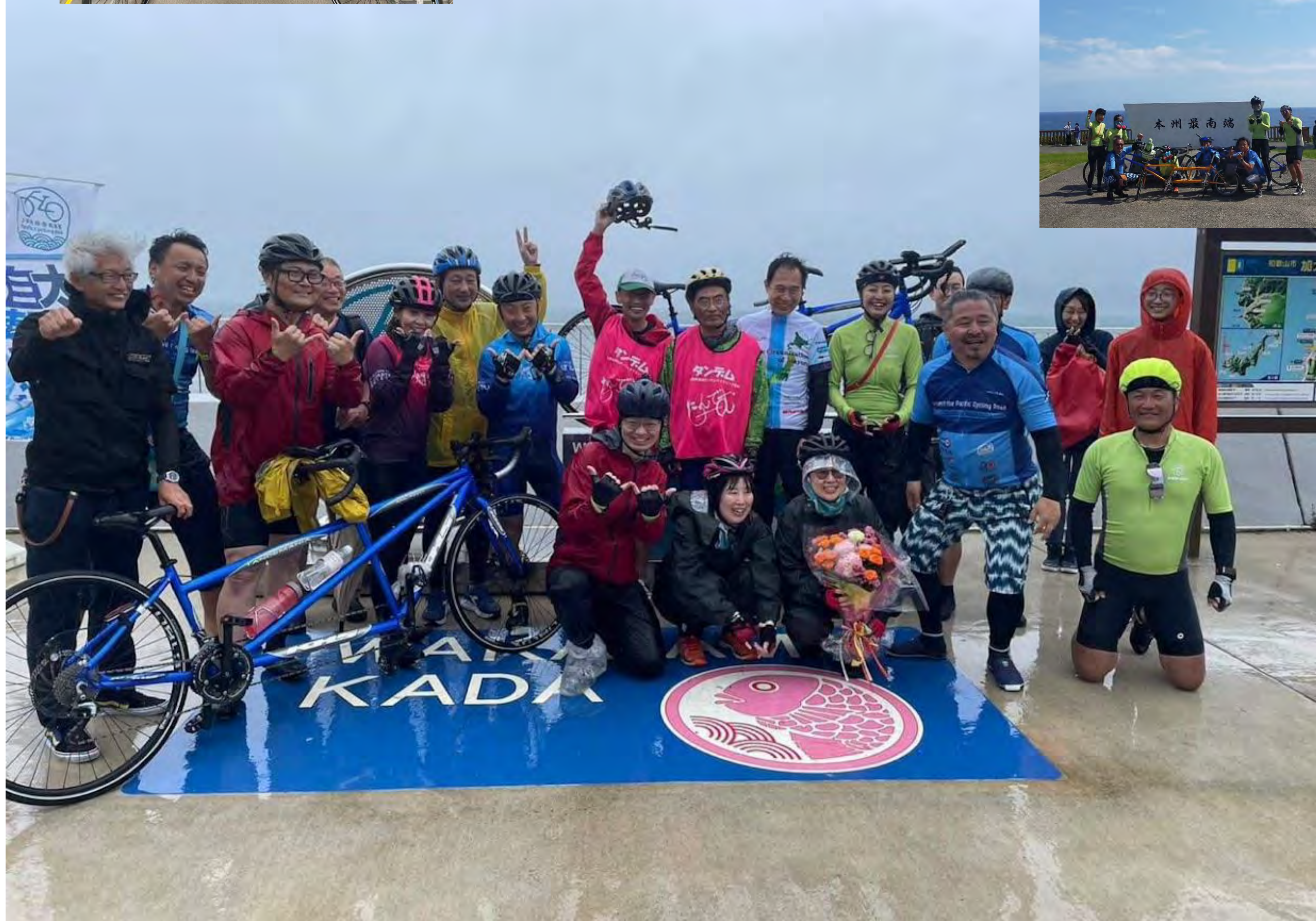
大雨の中 歓迎と感動のゴール！！（和歌山市加太）