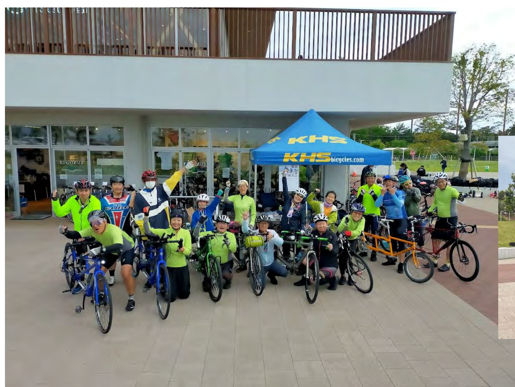
関東のタンデム愛好家が集まってくれた 現地にてタンデム体験会開催も （神奈川県）