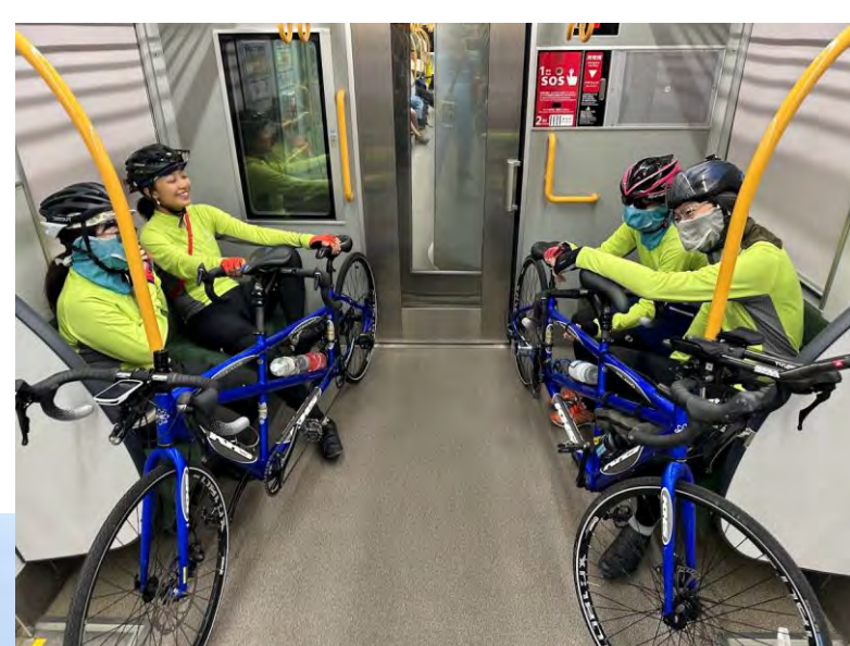
サイクルトレインにも乗車！！ （和歌山県すさみ町）