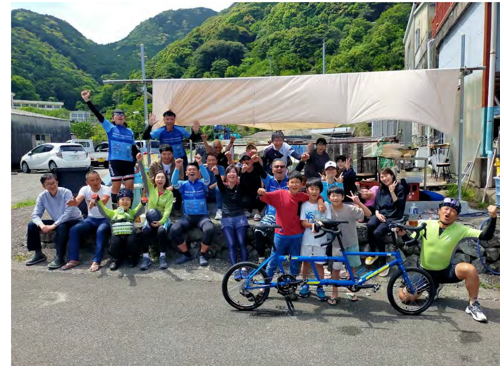
お子さんのタンデム体験で元気をもらう 海の幸の昼食まで ありがとうございました