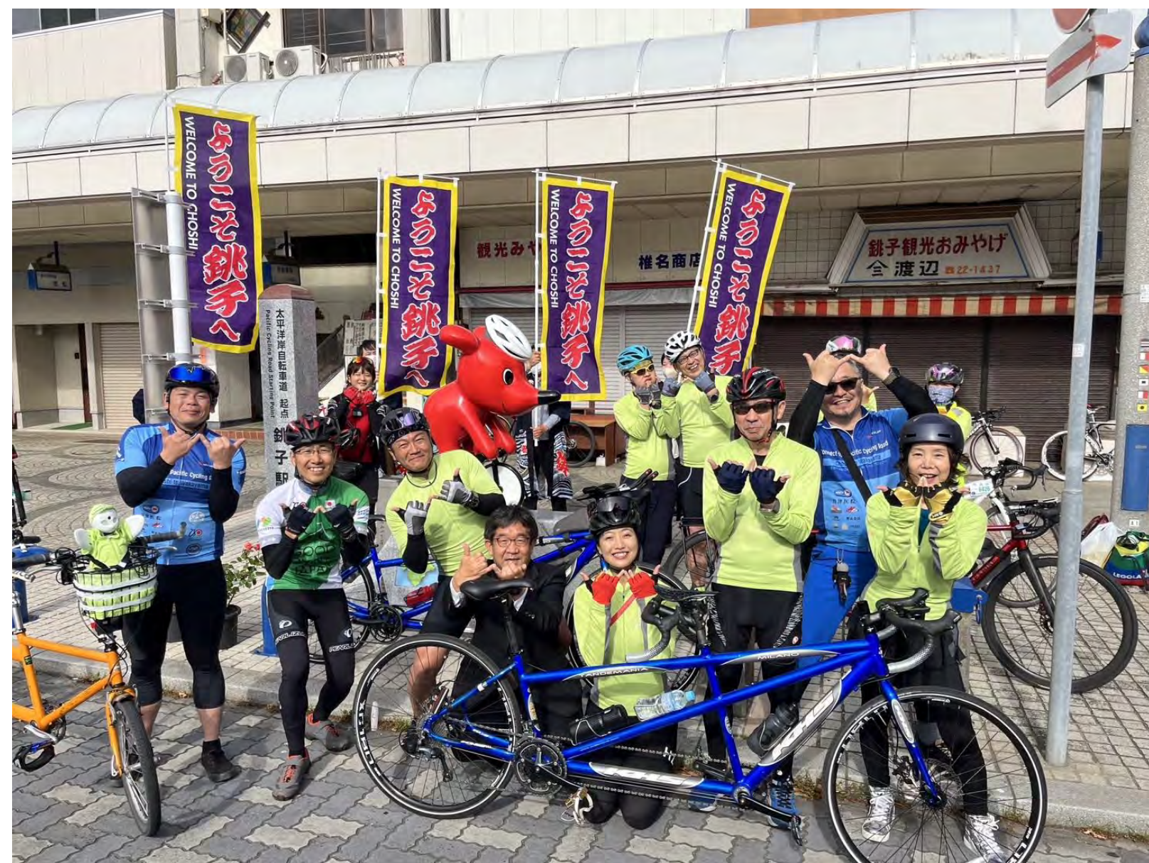
歓迎を受け元気にスタート（千葉県銚子市）

障がいをお持ちの方・地域の方と共に タンデム自転車で 太平洋岸自転車道を 全走破 できました！ 2023年4月29日から5月7日（計9日間） 暖かいご協力、ご支援をありがとうございました！！