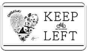
#ちがさき×タウンニュース