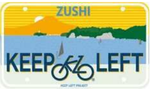
逗子・歩行者と自転車のまち を考える会

ORIGINAL PLATE PATTERN シンプル5・ローカル9 アーティスト9・コラボ15