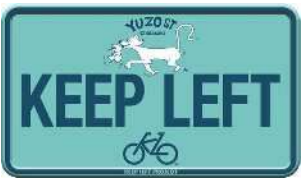
雄三通りスマイルプロジェクト