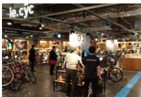
ring-ring square Tsukuba

The number of Tsukuba-Kasumigaura Ring-Ring Road users