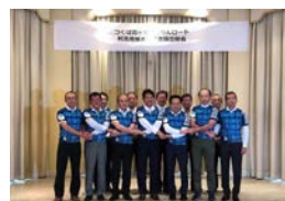
Association for Promotion of Tsukuba-Kasumigaura Ring-Ring Road