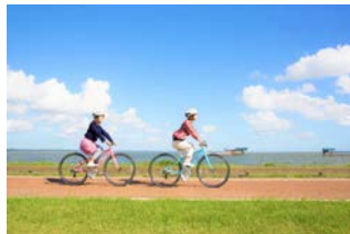
Kasumigaura lake shore

「つくば霞ヶ浦りんりんロード」は全体として平坦で走りやすいコースとなっており、サイクリング初心者の方でも安心して走行ができます。また、平坦なコースでは物足りない上級者の方はコースから足を伸ばせば、筑波山のヒルクライムコースもお楽しみ頂けます。