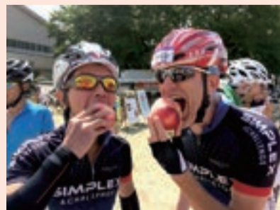
2017年シーズンは16-18地域で開催予定 *2012-2016累計で「32,750人」参加 *2017シーズンは「15,000人」程度参加予定