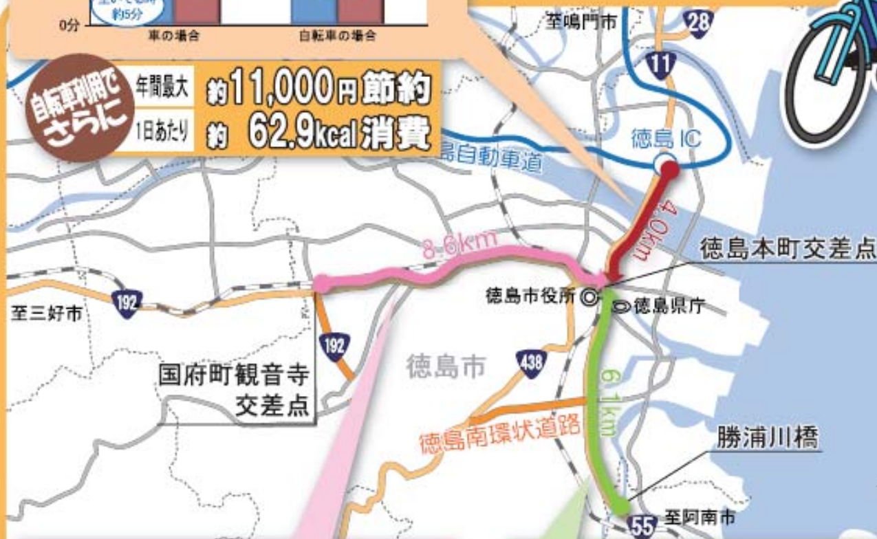
国府町観音寺交差点→徳島本町交差点間(8.6km)の混雑・非混雑時別所要時間

自転車利用で さらに 年間最大 約11,000円節約 1日あたり 約62.9kcal消費