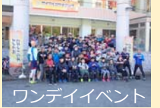
ワンデイイベント