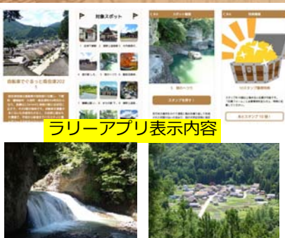
ラリーアプリ表示内容