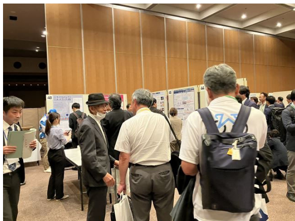
【参考】「第 11 回自転車利用環境向上会議 in 敦賀・若狭」でのポスターセッションの様子